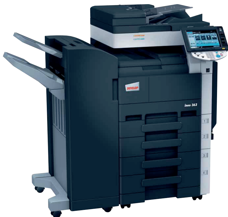
Ineo 363 со степлирующим финишером (FS-527) и универсальной тумбой (PC-208)

Ineo 363/423 от Developer приносит в мир черно-белой печати возможности, ранее доступные только системам цветной печати. Цветной сканер, например, позволяет сохранять цветные документы в мельчайших деталях. Интуитивно понятный и простой в использовании цветной сенсорный дисплей помогает оптимизировать документооборот в вашем бизнесе. Наличие сложных финишных функций позволяет сэкономить время и усилия при производстве готовых к использованию документов.